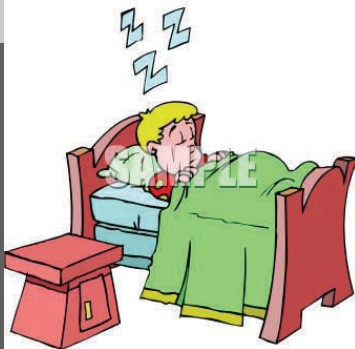
6. El hijo